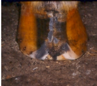
fisura anterioara sau a frunții

Își lasă toată greutatea pe partea cealaltă. Această condiție este cunoscută ca fisură laterală .